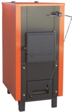
Vue de face de la chaudière

Le couplage avec une chaudière fioul se fait aussi aisément si besoin.