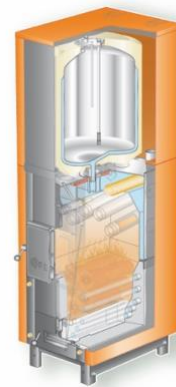
Vue intérieure de la chaudière